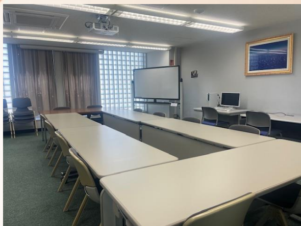
4階 グループ学習室A