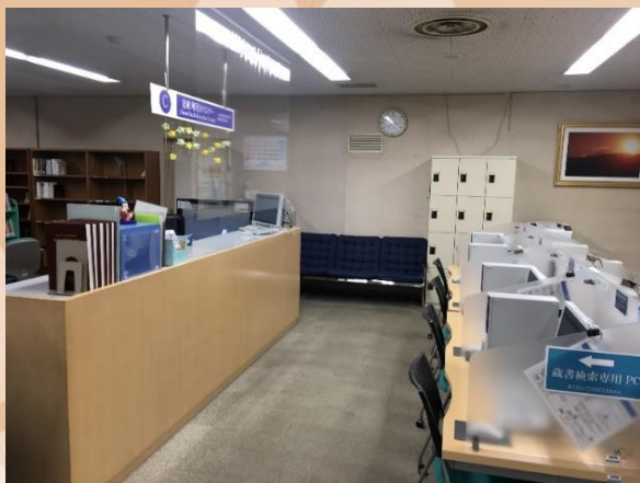
1階 書庫利用カウンター

4階閲覧室には 1名席が12席、 2名で視聴できるコーナー が2席あります。 ※各館での視聴は各館 カウンターで手続き してください。