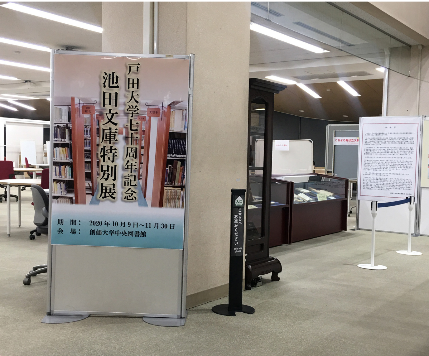
写真：戸田大学七十周年記念 池田文庫特別展