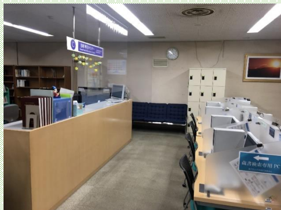
書庫利用カウンター