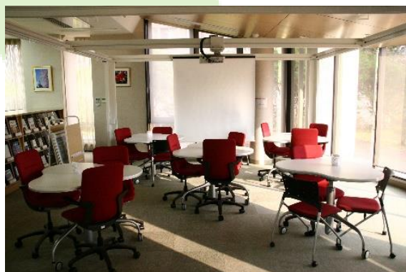
↑ミーティング・スポット（赤）