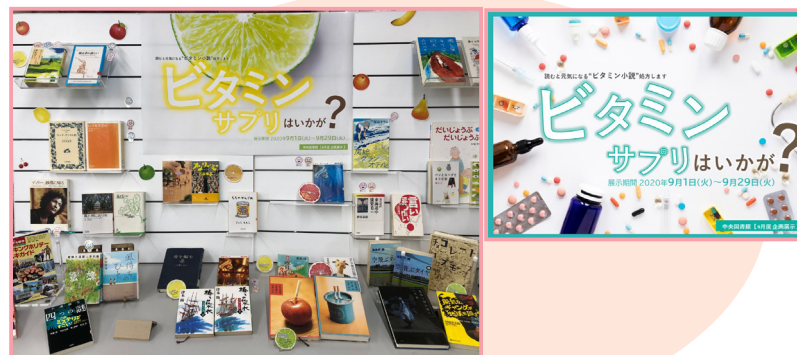
9月展示 【ビタミンサプリはいかが？】

心がほっとする本、感動で一杯になる本、ほのぼのする本 くすくす笑える本やおなかを抱えて笑える本などのテーマで 図書館スタッフお勧めの一書を展示しました。