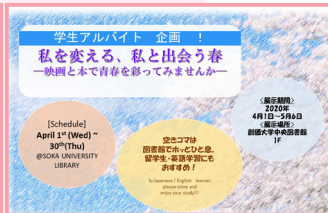
4月展示 【映画と原作本】