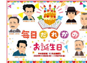
11月展示 【毎日誰かの誕生日】

365日それぞれ誕生日の作家を紹介！誕生日という共通 項で今まで知らなかった作家に親近感を持ってもらい新しい ジャンルの本や知らない作家の本を読むきっかけに。