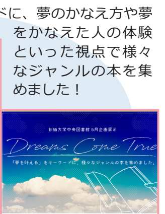
6月展示 【Dreams Come True】

図書館に日本語はもちろん中国語や英語のマンガやアニメの 本があるのをご存じでしょうか？7月は図書館にある様々な ジャンルのアニメやマンガにまつわる作品を展示しました。