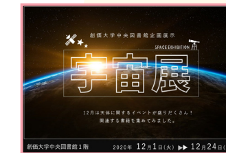
12月展示 【宇宙展 SPACE EXHIBITION】

12月2日は日本人初の宇宙飛行士誕生から30周年。また「は やぶさ2」の帰還、ふたご座流星群が見ごろをむかえるなど、 天体の話題に合わせて 興味関心を抱いてもらえ るような展示にしまし た。