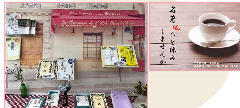
10月展示 【100分 de 名著 特集】

NHKで放送されている「100分 de 名著」で紹介された 名著&関連書籍を展示！読書の秋にふさわしい展示となりました。