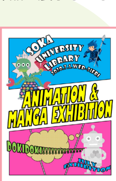
7月展示 【アニメーション&マンガ展】