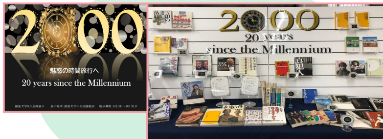
8月展示 【2000～20 years since the Millennium】

本年度は2000年になってから20年目ということで、2000 年に起こった出来事や流行したことにに関する本やベストセラー になった本を展示！