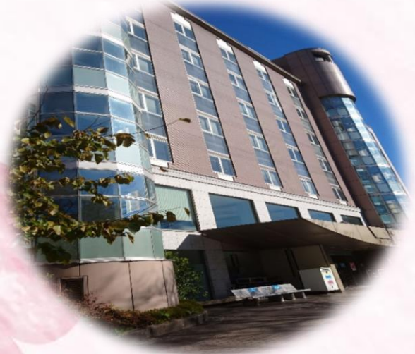
フレイザー図書館（理工学部E棟）