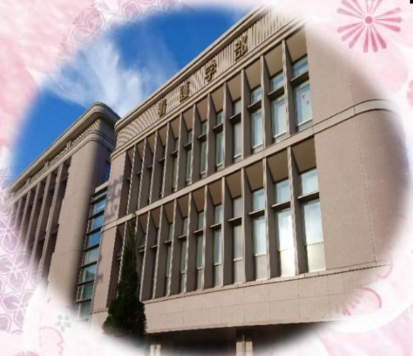
白樺図書館（看護学部棟）