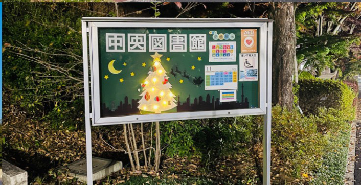
写真：冬の創価大学