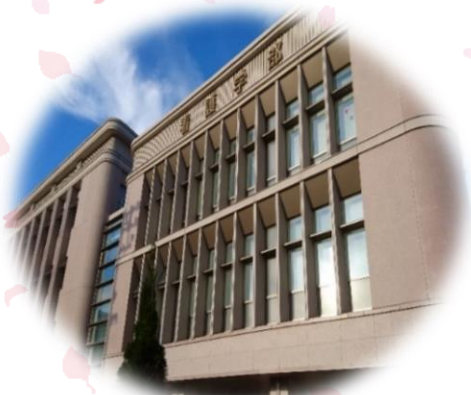
白樺図書館 (看護学部)