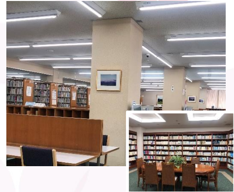
創始者著作コレクション展示室

3階閲覧室には、人文・自然科学系 図書、大型図書、文庫コーナーを 設置しています。 静寂ルームのため、パソコンなどの 電子機器は使用できません。 創始者著作コレクション 展示室を設置しています。