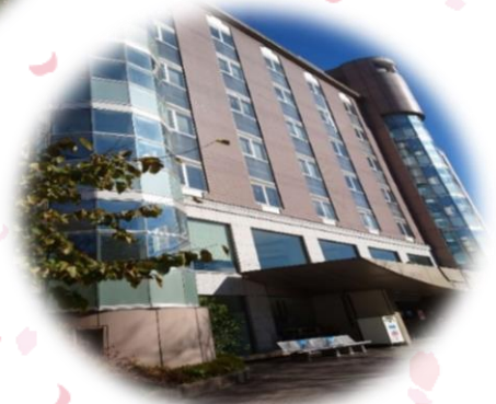
フレイザー図書館 (理工学部)